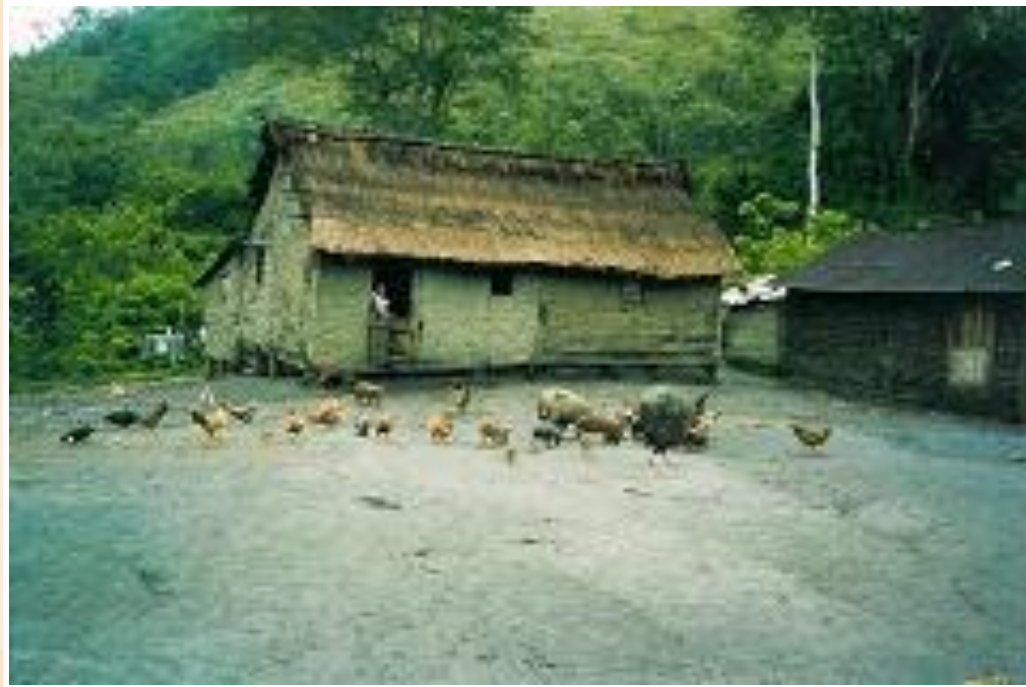
Comunidade Quilombola de Bombas