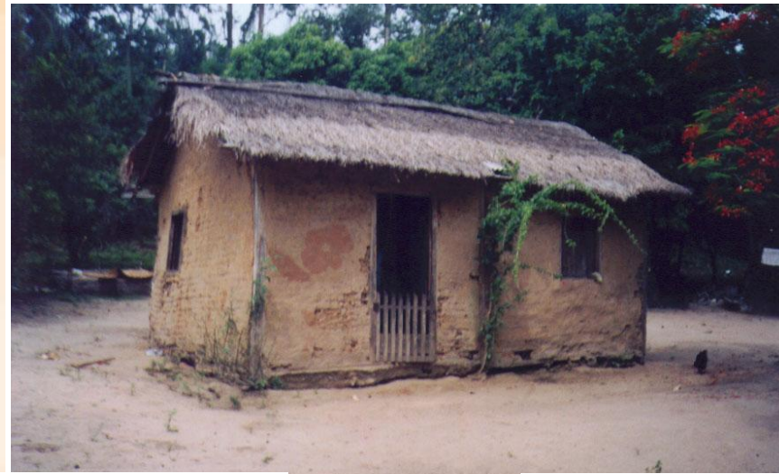
Comunidade Quilombola de Praia Grande