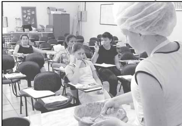
Cursos de qualificação do Sine formaram 1.456 profissionais