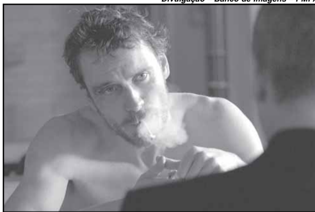
Cena do filme Hunger de Steve McQueen

Mostra de filmes — A mostra de filmes do evento Black , na sala P. F. Gastal da Usina do Gasômetro reúne uma série de títulos Blaxploitation , movimento cinematográfico de características muito particulares, surgido nos EUA na década de 1970. Os filmes deste movimento eram dirigidos e/ou