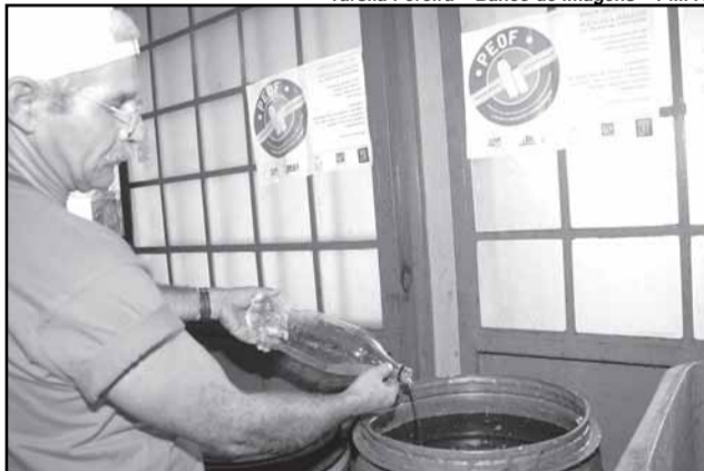
Desde 2007, foram instalados 120 postos de coleta de óleo na Capital

A Casa Brasil (rua Voluntários da Pátria, 2.552) e a Escola Municipal José Mariano Beck (rua Joaquim Porto Villanova, 135, Vila Bom Jesus) são os dois novos postos do Projeto de Reciclagem de Óleo de Fritura, promovido pelo Departamento Municipal de Limpeza Urbana (DMLU). Cri-