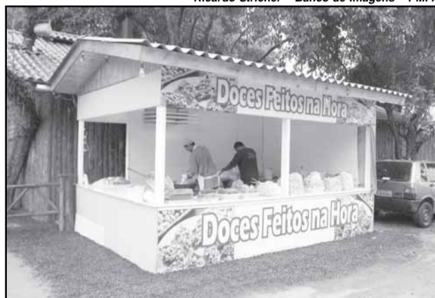
Público gosta de acompanhar o preparo dos doces que comprarão em seguida