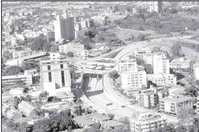
Representantes vão decidir sobre políticas de crescimento e projetos que provocam mudanças no dia-a-dia das pessoas