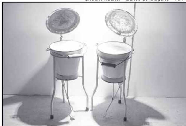
Aberta até quarta-feira, Dualidades reúne obras de quatro artistas plásticos

Encontros com a Arte no Paço — Nesta edição da série Encontros... estão expostas, no gabinete do prefeito até meados de outo-