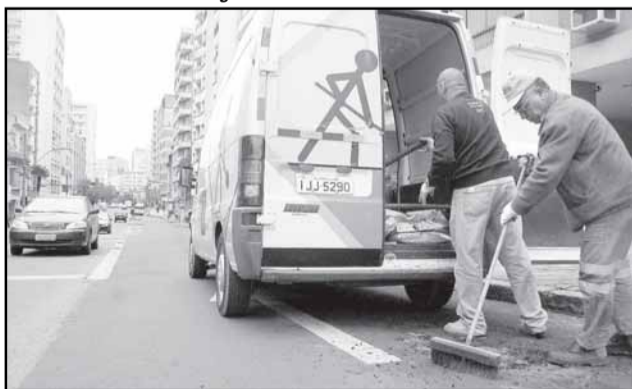
O veículo circula diariamente garantindo reparos na pavimentação das ruas e avenidas

A Van Tapa Buracos, da Secretaria Municipal de Obras e Viação (Smov), recuperou até setembro 688 metros quadrados de vias, com a aplicação de 37,5 toneladas de asfalto. O veículo circula diariamente pela Capital identificando os problemas e garantindo a pronta-resposta das demandas de reparos na pavimentação das ruas e avenidas, inclusive em dias de chuva.