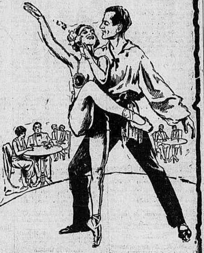
Um film do Programa Matarazzo

Peregrinos da ambição, eivo a caminho de Londres. Mas quão diversa sorriu a Fortuna de cada um!