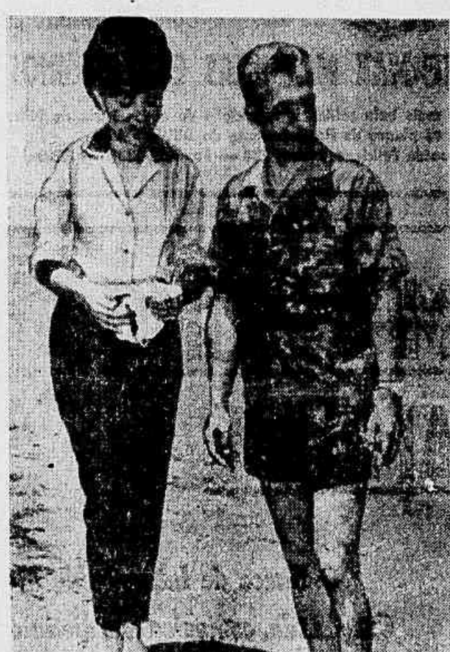
O Xô do Irã, Reza Pahlevi e sua mulher, Farah Diba, passam as férias reais numa praia do Nourshahr, no Mar Caspio. A foto acima foi conseguida apesar dos rigorosos medidas de segurança que envolvem o casal.