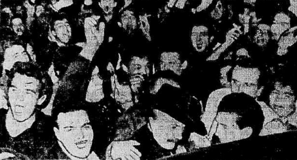
Um dos poucos incidentes ocorridos no domingo, durante as eleições argentinas, foi a agressão de Alfredo Palacios (foto, de chapéu preto) candidato do Partido Socialista, pelos peronistas, que quebraram a janela de seu carro.

Ontem, foi assaltado um caminhão carregado de leite, que foi distribuído gratuitamente aos moradores do bairro de Vila Lugano. O caminhão transportava 4.800 litros de leite.