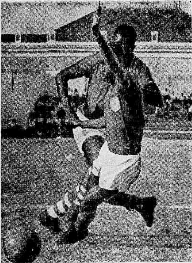
Os jogadores do Bonsucesso esperam chegar sempre na frente nos lances de hoje contra o Botafogo que chegou cansado, como aconteceu em grande parte do jogo de estreia contra o América, quando os rubro-ros foram derrotados apenas por 1 a 0.

O quadro para logo mais será, portanto, o seguinte: Antoninho ou Jonas; Marcelo, Pínto, Décio e Ernani; Lelé e Paulinho; Roberto, Adauri, Rato e Borges.