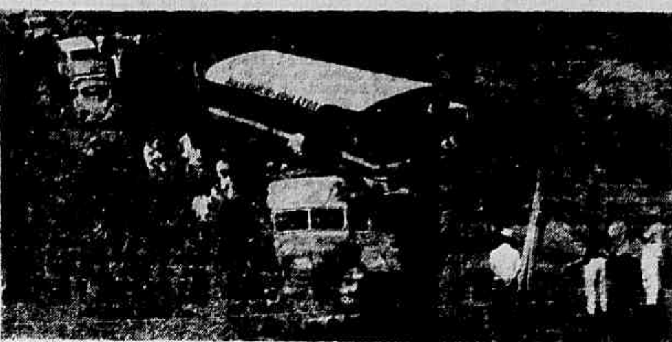
Um aspecto do local do acidente, no momento em que o ônibus era rebocado. O Citroen encontra-se atrás do coletivo.