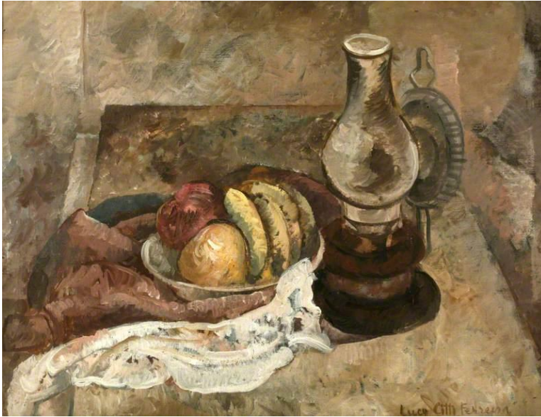
Figura 01. Lucy Citti Ferreira, Natureza morta com candeeiro, (1943). Técnica: Óleo sobre tela, 64 x 81 cm. Acervo: Manchester Art Gallery.

realizar obras interessantes ao público. Prova disto, são as aquisições realizadas naquela exposição, bem como a incorporação de seu trabalho a acervos públicos. Nesse sentido, as escolhas editoriais do periódico revelam a duplicidade de papéis da artista e impedem que sua participação na narrativa modernista brasileira se resume a de modelo.