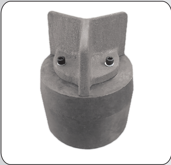
ROLO PARA ÊMBOLO DE PRESSÃO COM ALETAS INTERCAMBIÁVEIS