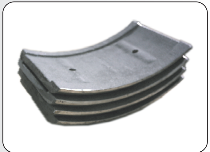
SEGMENTO DO ÊMBOLO EM (Ni-HARD)