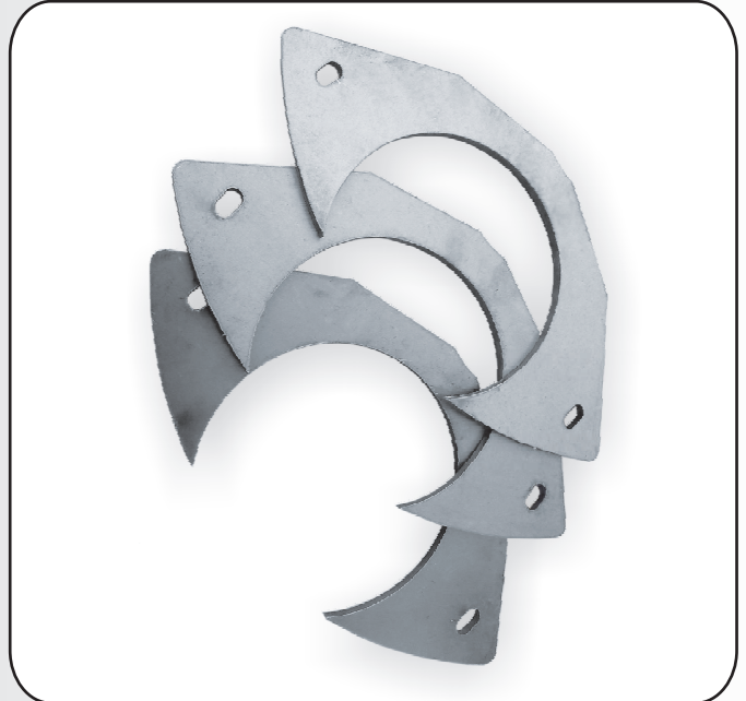
KIT DE PROTEÇÃO DO ROLO DE PRESSÃO