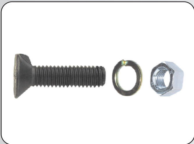
KIT DE FIXAÇÃO - DIN 604