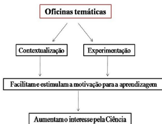
FIGURA 1- Princípio das Oficinas Temáticas

Para o desenvolvimento de uma oficina temática, é necessário levar em consideração dois princípios: contextualização e experimentação. Por meio da Figura 1, é possível analisar como eles estão relacionados.