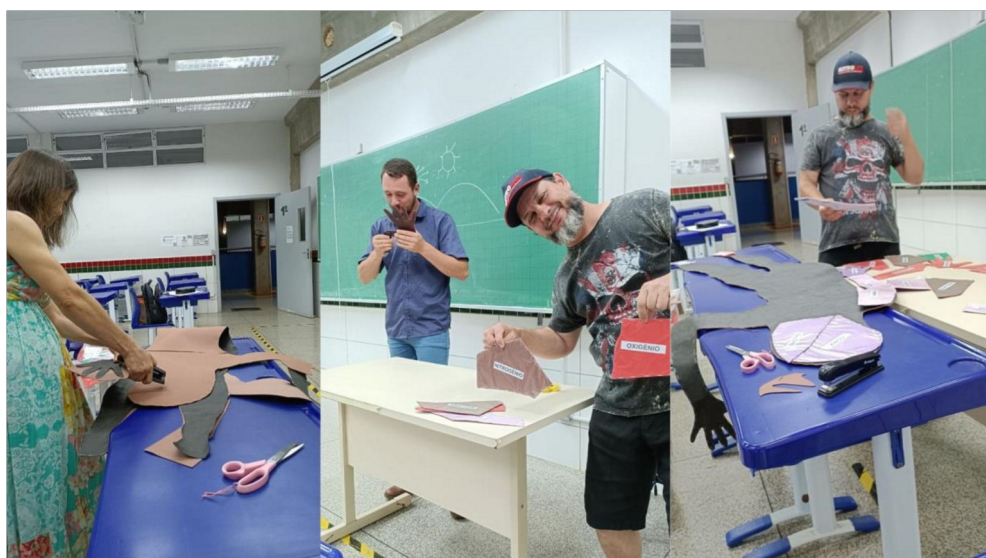
Figura 1. Construção do jogo.

Com os materiais em mãos, começamos a construção do jogo imprimindo os elementos químicos, colocando os mesmos em uma placa de EVA. Em seguida recortamos a silhueta contornando-a, e para deixá-la mais firme grampeamos Eva atrás do papel Kraft. Para finalizar recortamos as peças de EVA onde estavam os elementos, em formatos diversos os quais se encaixavam na silhueta, colorindo a mesma, conforme Figura 1 e Figura 2: