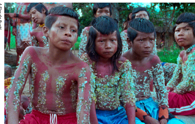
A Flor do Buriti