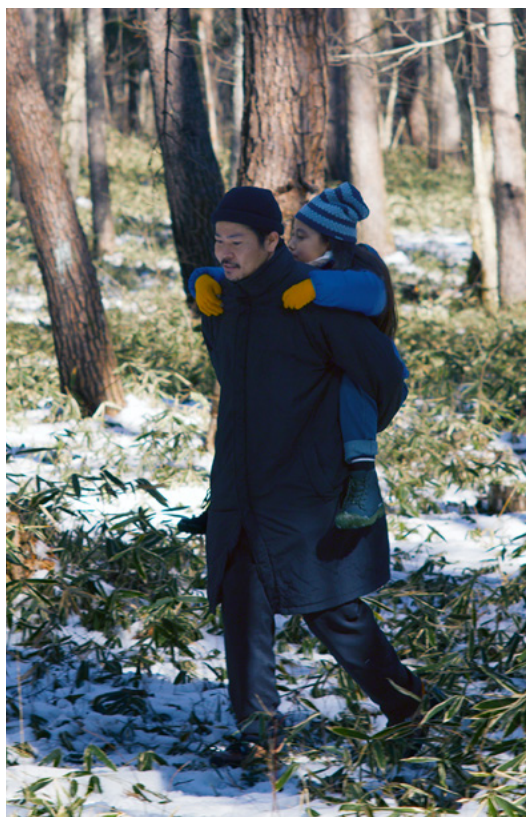
Evil Does not Exist – O Mal não Está Aqui