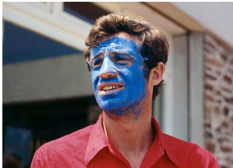
Pedro, o Louco

"Foi o único filme 'clássico' que tive a oportunidade de fazer, no interior do sistema: filme de prestígio, autor conhecido, vedetas conhecidas, realizador original. Era um pouco um filme hollywoodiano." J-LG