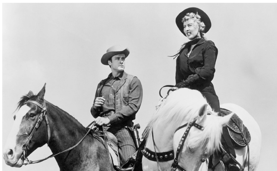
Forty Guns - Quarenta Cavaleiros

[ Lista de J-LG dos 10 Melhores Filmes de 1965, Cahiers ]