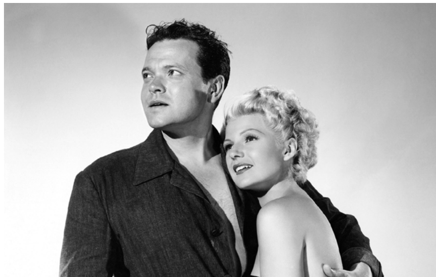
A Dama de Xangai