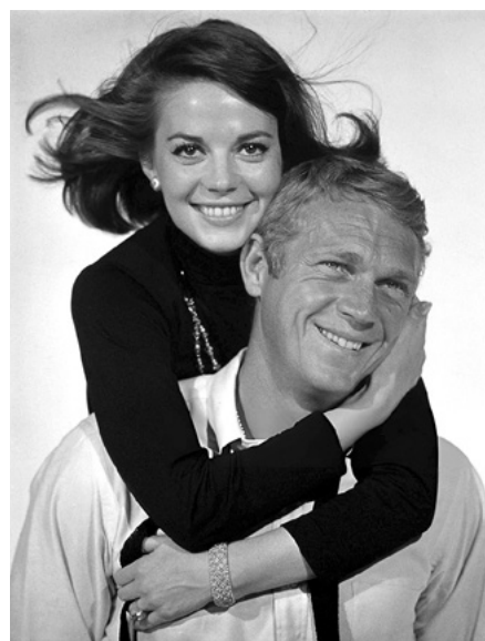
Amar um Desconhecido

[ Lista de J-LG dos 10 Melhores Filmes de 1960, Cahiers ]