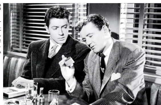
O Desconhecido do Norte-Expresso

"É o filme mais inteligente do mundo. A arte ao mesmo tempo que a teoria da arte." - J-LG