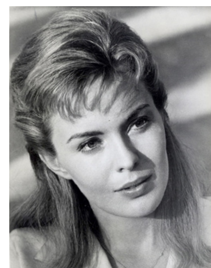
Lilith e o seu Destino

[ O melhor filme de 1961; lista de J-LG dos 10 Melhores Filmes, Cahiers ]