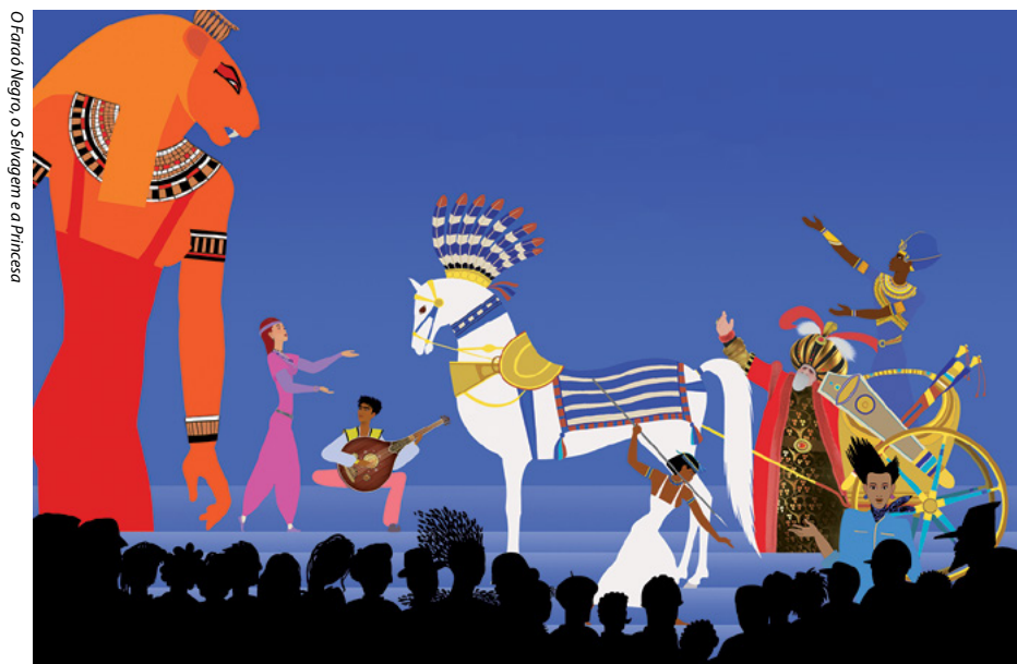
O Faraó Negro, o Selvagem e a Princesa