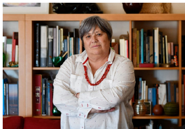
Ana Luísa Amaral

Atraído pela poesia de William Carlos Williams, Jim Jarmusch realizou este filme precioso, para o qual contou também com a colaboração do poeta Ron Padgett.