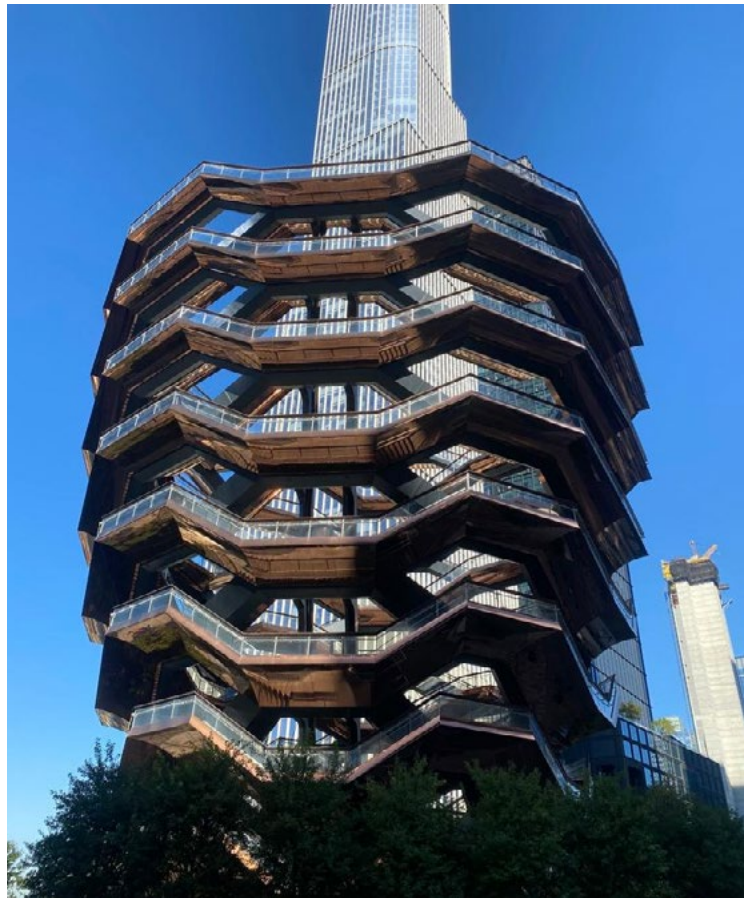
Bela escultura no Hudson Yards

Bem cedo, no sábado (22) pela manhã os representantes do JORNAL MG TURISMO deixaram o excelente San Carlos Hotel, no elegante East Side, onde, mais uma vez, estão hospedados em Nova York, para conhecerem o famoso Hudson Yards.