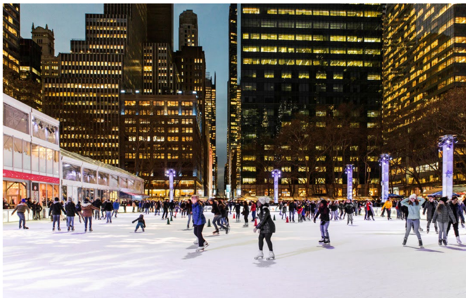
Pista de patinação no gelo no Bryant Park, que também terá lojas, shows, eventos e comidinhas e bebidas