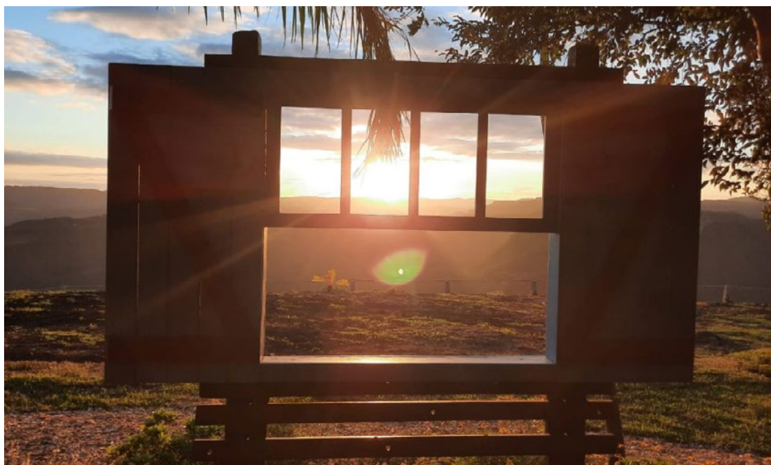
Belvedere do Sol, com a Janela da Alma, devem abrir para visitação em 2022

O Festuris, um dos eventos de negócios mais relevantes para o trade de turismo no Brasil, realizou a cerimônia de abertura do Palácio dos Festivais em Gramado. O par-