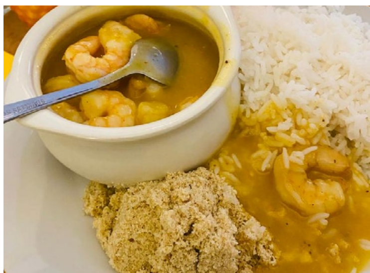
Camarão é destaque no Bar Goyana