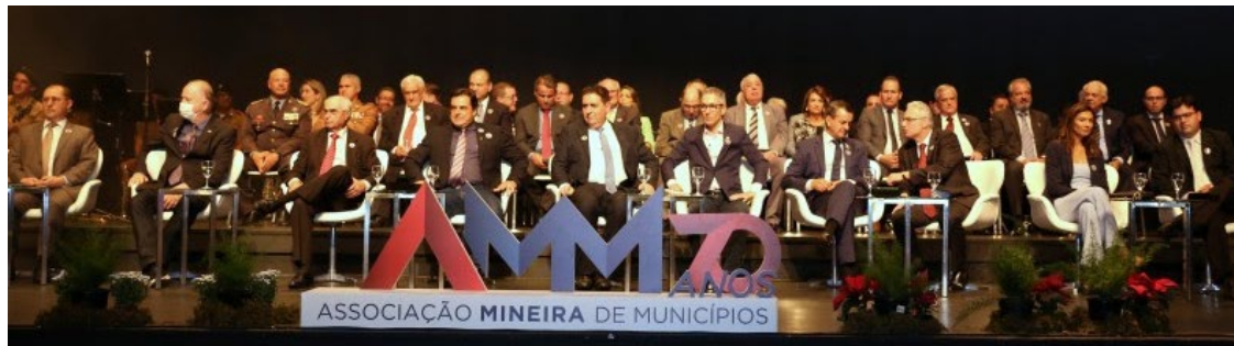
Presidente da AMM com lideranças municipalistas

Na noite desta segunda, 7 de novembro, a Associação Mineira de Municípios (AMM) comemorou a marca histórica de 70 anos de sua fundação com uma cerimônia no Palácio das Artes, em Belo Horizonte, marcada pela presença de centenas de prefeitos mineiros, lideranças políticas, do mundo oficial, além da presença do governador do Estado, Romeu Zema. Outro destaque do evento foi a apresentação da nova programação visual da AMM, além das ações, serviços e conquistas da entidade.