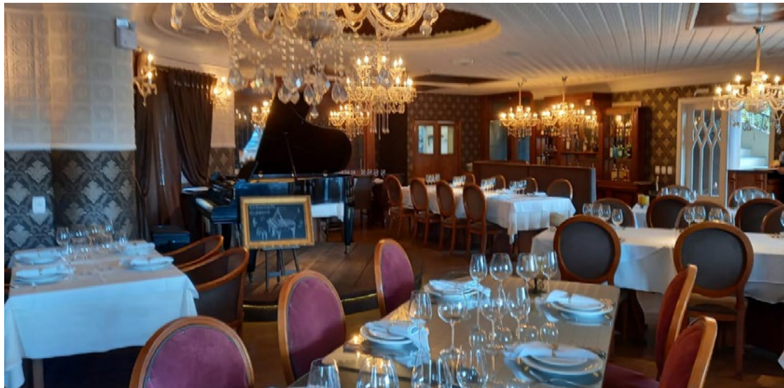
Visita do luxuoso restaurante em Gramado

O ambiente e a decoração do restaurante são baseados em figuras que retratam o Coliseu de Roma, na Itália. O nome vem da expressão latina Colosseum, devido à estátua colossal do impera-