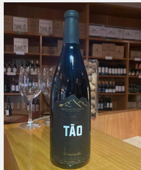
O vinho brasileiro é sucesso no restaurante "Topo do Mundo"

Advogada, proprietária do Restaurante Topo do Mundo, Enoteca Brasileira em Nova Lima/MG e Vineria Capivari em Campos do Jordão/SP, enófila e apaixonada por vinhos brasileiros