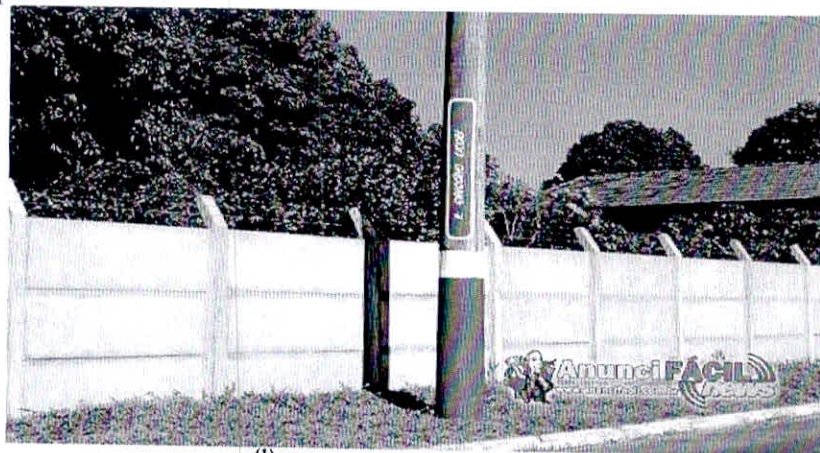
(1) Figura 1: Exemplo de Cornélio Procópio.

Desta feita, pelo todo exposto, solicito aos Nobres Pares a aprovação da presente propositura.