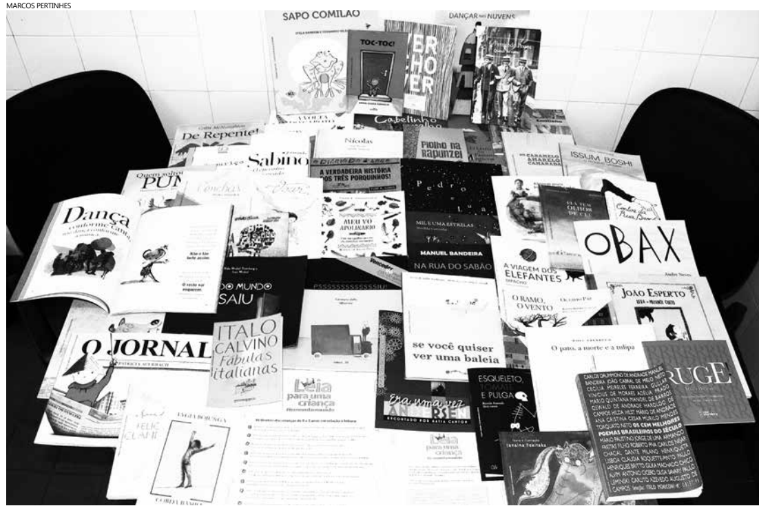
São 27 kits com cerca de 50 livros de autores brasileiros e destinados a alunos de diversas faixas etárias

São 27 kits com cerca de 50 livros de autores brasileiros e destinados a alunos de diversas faixas etárias. Os livros são de excelente qualidade de impressão