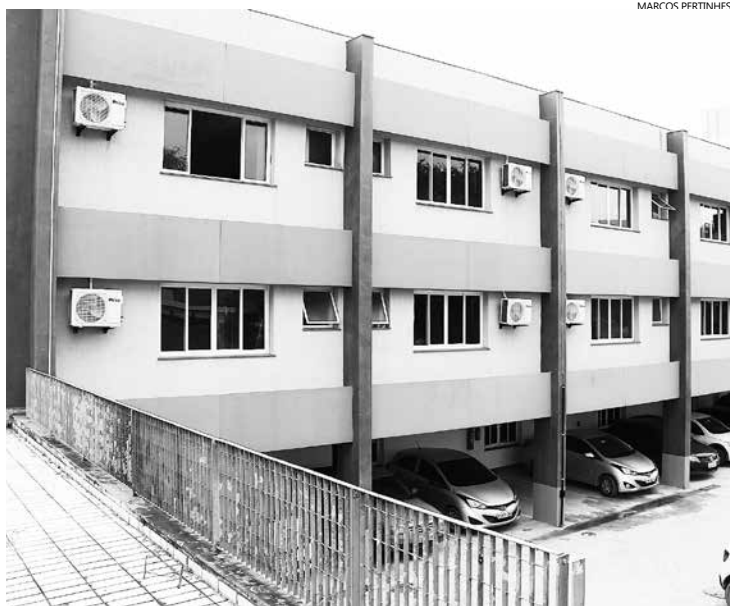
O novo espaço será construído em terreno onde hoje funciona a Câmara Municipal, no Rio da Praia

Os serviços preliminares já começaram, com a sondagem do terreno. A unidade será construída em área de 732 m 2 , de um terreno