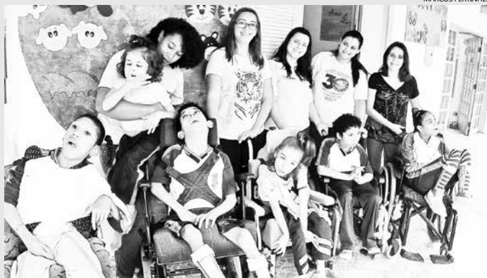
No CEE, os alunos são atendidos por uma equipe de educadores, que desenvolvem atividades utilizando metodologias específicas para o atendimento às necessidades de aprendizagem

Eles se interessaram pelo projeto que dá atendimento educacional especializado para crianças com necessidades especiais. O grupo também conheceu a Casa do Educador