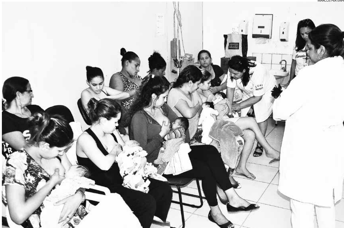
Encontros visam estimular o acompanhamento pré-natal da gestante e a preparação da mãe para os cuidados com o recém-nascido no pós-parto e na amamentação.

O curso acontece às segundas e quartas-feiras de cada mês, a