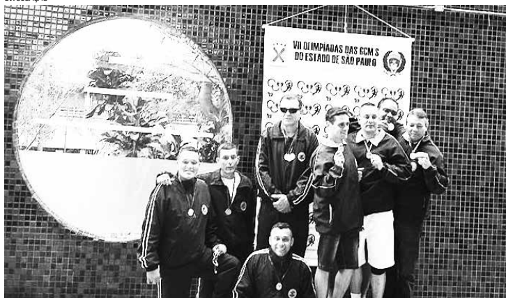
GCMs de Bertioga representam a Cidade e se destacam em Santo André conquistando 115,5 pontos

Bertioga vem se destacando na 7ª edição das Olimpíadas das Guardas Municipais do Estado de São Paulo, que está acontecendo em Santo André, região do Grande ABC paulista. Com a participação em apenas três das seis modalidades já realizadas (judô, jiu-jitsu e natação), o Município atualmente ocupa o segundo lugar no quadro geral de medalhas, com 115,5 pontos.