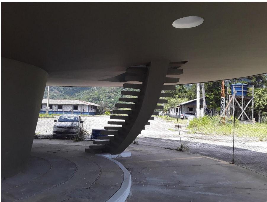
Figura 2 – Recuperação do Belvedere do Grinco 089+000/RJ.