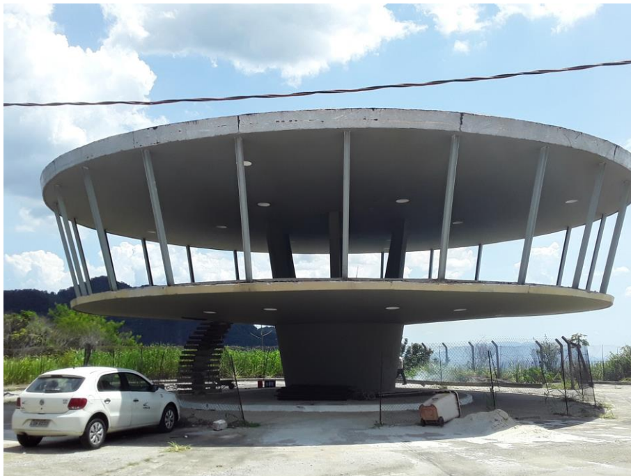
Figura 5 – Recuperação do Belvedere do Grinco 089+000/RJ.