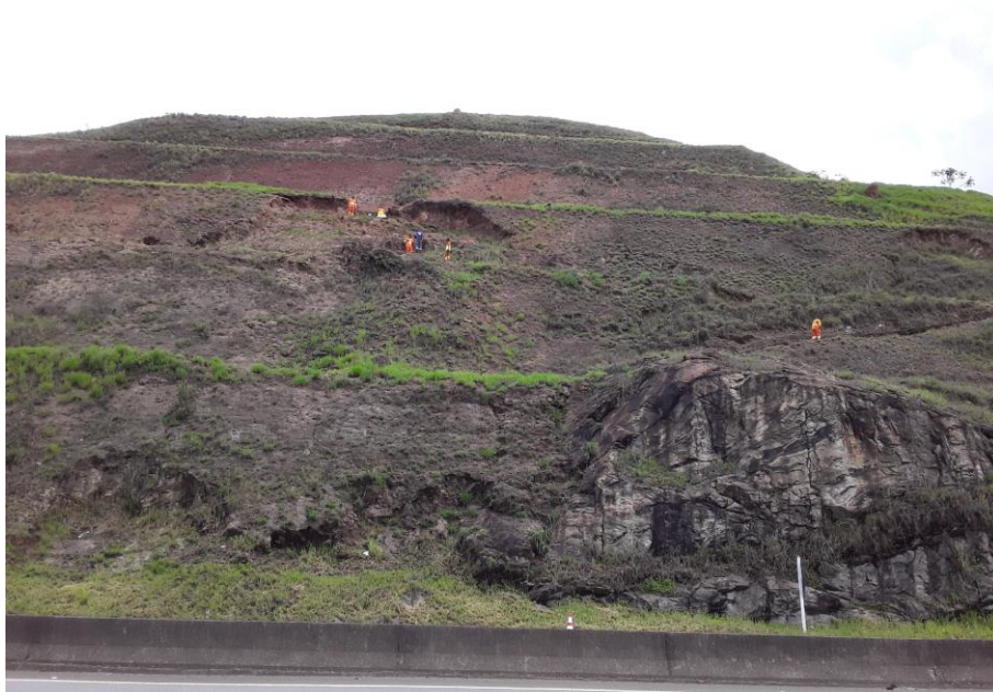
Figura 7 – Estrutura de contenção 776+500/JF.