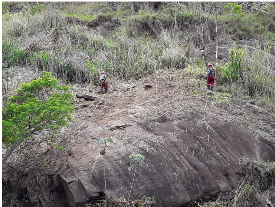
Figura 10 – Estrutura de contenção 039+440/RJ.