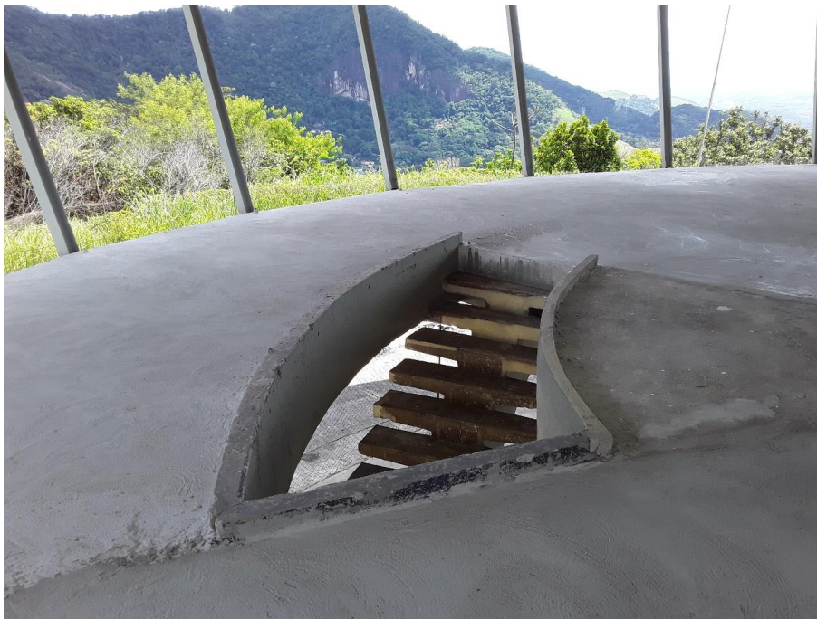
Figura 3 – Recuperação do Belvedere do Grinco 089+000/RJ.