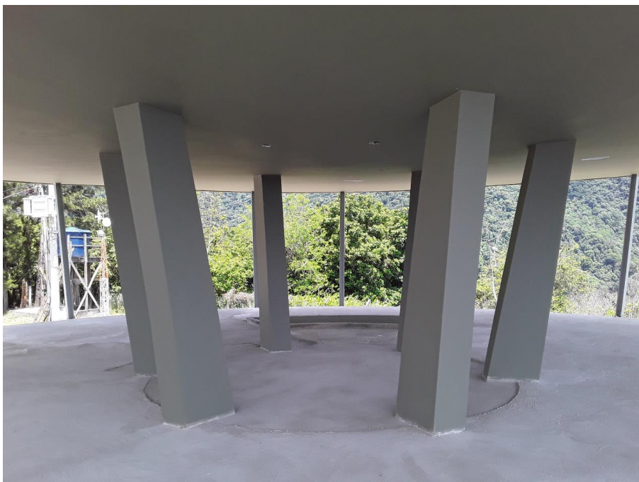
Figura 4 – Recuperação do Belvedere do Grinco 089+000/RJ.