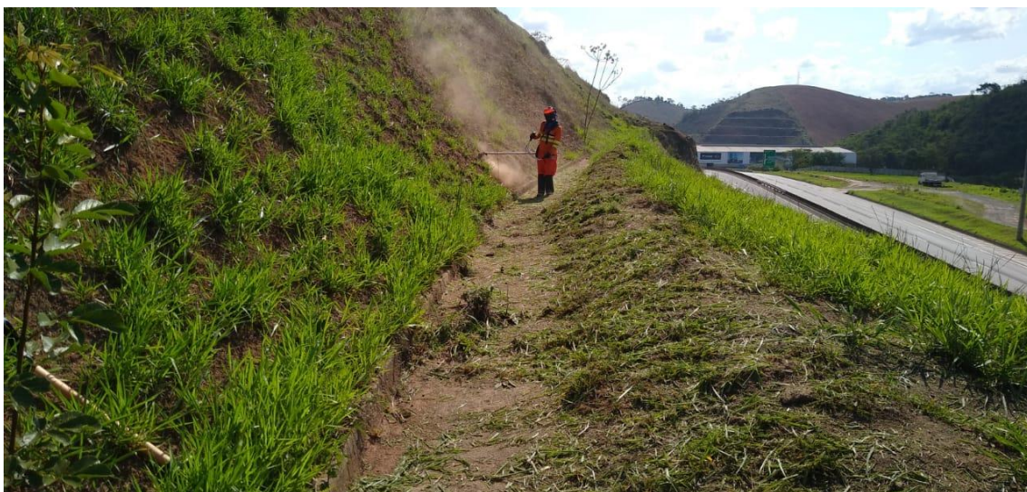
Figura 6 – Estrutura de contenção 776+500/JF.