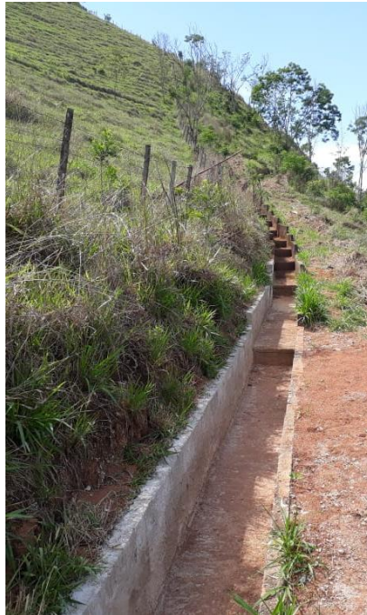
Figura 9 – Estrutura de contenção 039+830/RJ.