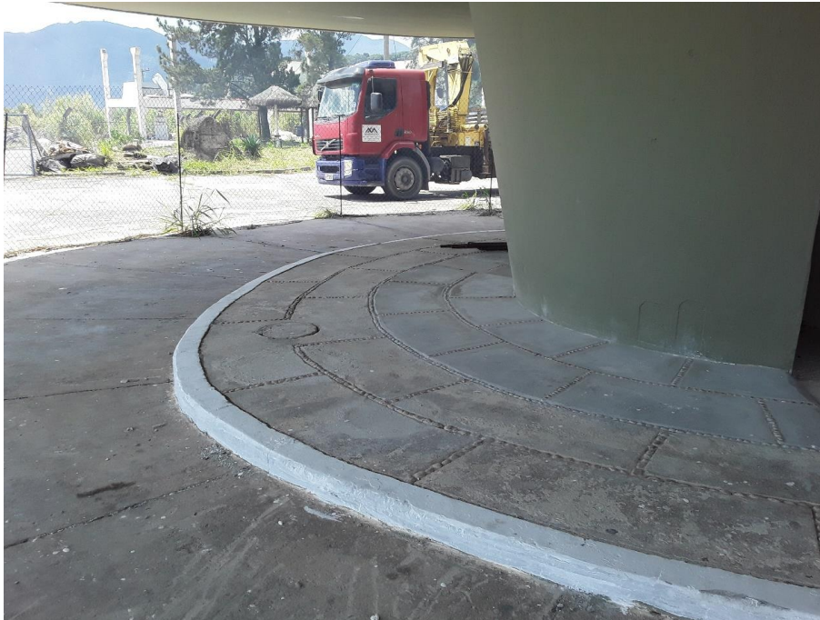
Figura 1 – Recuperação do Belvedere do Grinco 089+000/RJ.