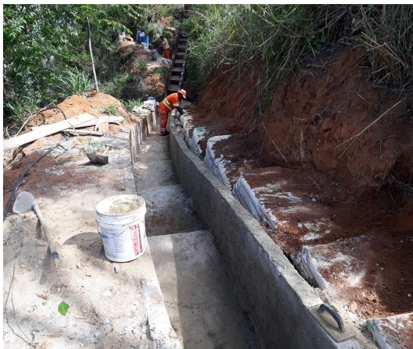
Figura 8 – Estrutura de contenção 039+830/RJ.