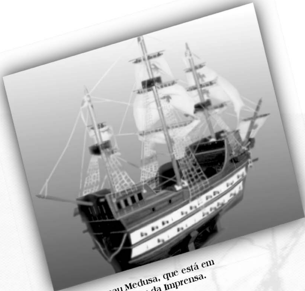
Réplica da nau Medusa, que está em exposição no Museu da Imprensa.

...os primeiros prelos da Imprensa Régia vieram nos porões da nau Medusa, quando da transferência da Corte Portuguesa para o Brasil, trazendo à colônia inestimáveis benefícios, dentre os quais, a criação de uma Imprensa Oficial?