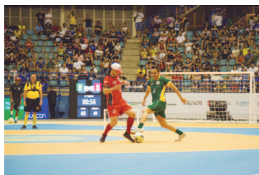
Séan Garnier e Falcão em duelo na terceira edição

A quinta edição do Reis do Drible, dia 22 de dezembro, em São Bernardo do Campo (SP), confirma mais um atleta que promete fazer sucesso na competição em que dribles valem tanto ou mais do que gols marcados. Revelação do Campeonato Brasileiro de Futebol de 2019, o atacante Michael, do Goiás, estará em quadra ao lado do craque Falcão, do Futsal, e do Rei do Freestyle, o francês Séan Garnier no evento programado para o