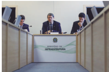
Ministro da Infraestrutura, Tarcísio Gomes de Freitas

O ministro da Infraestrutura, Tarcísio Gomes de Freitas, disse na sexta-feira (13) que o governo pretende realizar leilões de 40 a 44 ativos de infraestrutura no próximo ano. A expectativa é que os projetos de concessão de portos, aeroportos, rodovias e ferrovias alcancem R$ 101 bilhões em investimentos durante o período de duração dos contratos.