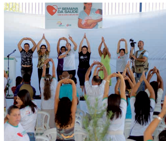
A feira teve início com a prática de exercícios físicos