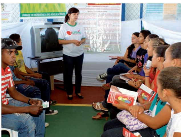
Adolescentes assistiram palestras do Programa Saúde do Adolescente – Prosad

Cerca de 110 pessoas foram atendidas no estande de hipertensão e diabetes. Mais de 100 realizaram o exame de câncer de mama, entre elas 12 alterações mamárias foram encontradas e encaminhadas imediatamente para a médica mastologista. Vinte pacientes fizeram o exame de hanseníase com dois casos suspeitos e outras dezenas de pessoas puderam colocar o cartão de vacinação em dia. Mais de 80 participantes foram examinados