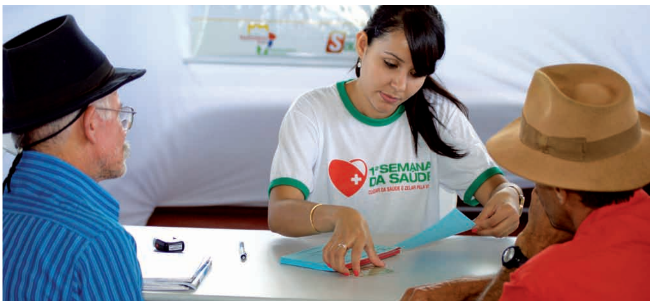
Outras opções nos estandes foram de avaliação nutricional, tuberculose, orientação vocacional, métodos contraceptivos, laboratórios de endemias, prótese dentária