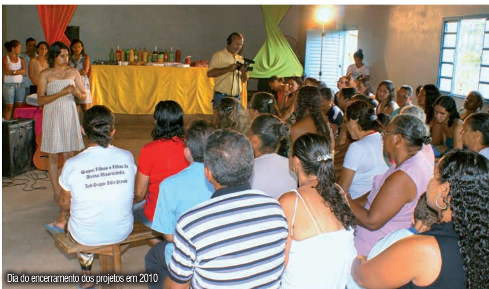
Dia do encerramento dos projetos em 2010