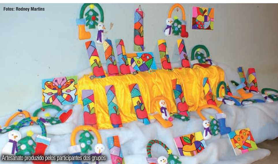
Artesanato produzido pelos participantes dos grupos

Os dois projetos envolvem trabalhos sócio-educativos de orientação, informação, troca de experiências, confec-